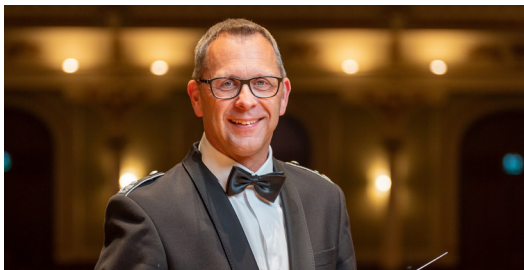
Oberstleutnant Christian Weiper, Leiter des Musik- korps der Bundes- wehr

Das Musikkorps der Bundeswehr gehört zu den weltbesten sinfonischen Blasorchestern. Die Musiker - Damen und Herren - sind auf vielen großen Bühnen im In- und Ausland zu Hause.