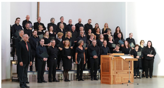
reger chor köln

Der reger chor köln widmet sich dem Vortrag geistlicher Werke vom Frühbarock bis in die Gegenwart. Der allseits anerkannte Chor zählt heute zu den renommierten Klangkörpern in NRW und ist regelmäßig in der Trinitatiskirche zu Gast.