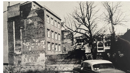
Ehemaliger Sitz des Ev. Kirchen- verbandes in der Antongasse

mit Bernhard Seiger , Stadtsuperintendent des Ev. Kirchenverbandes Köln und Region