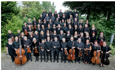
Rodenkirchener Kammerchor und Orchester

Fast so schön wie der Klang eines Konzertes ist sein Nachklang. Deshalb lädt das Netzwerk Kölner Chöre nach den Konzerten dieser Reihe ins Foyer der Trinitatiskirche ein. Die Getränke sind im Eintrittspreis enthalten.