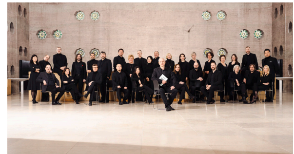
WDR Rund- funkchor