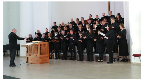
reger chor köln

Der reger chor köln widmet sich dem Vortrag geistlicher Werke vom Frühbarock bis in die Gegenwart. Der allseits anerkannte Chor zählt heute zu den renommierten Klangkörpern in NRW und ist regelmäßig in der Trinitatiskirche zu Gast.