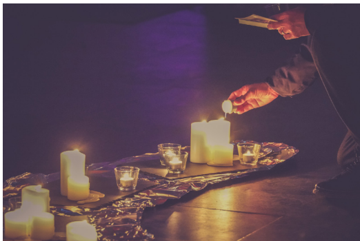
Nacht der Lichter

Die „Nacht der Lichter“ ist mehr als eine Veranstaltung; sie ist eine Gelegenheit, gemeinsam etwas zu bewegen, Wissen zu verbreiten und diejenigen zu unterstützen, die von dieser Krankheit betroffen sind. Seien Sie Teil dieses besonderen Abends und setzen Sie ein Zeichen der Liebe, Solidarität und Erinnerung. Gemeinsam können wir die Dunkelheit durchbrechen und das Licht der Hoffnung entzünden.