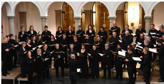
Chor des Bach-Vereins Köln

Fast so schön wie der Klang eines Konzertes ist sein Nachklang. Deshalb lädt das Netzwerk Kölner Chöre nach den Konzerten dieser Reihe ins Foyer der Trinitatiskirche ein. Die Getränke sind im Eintrittspreis enthalten.