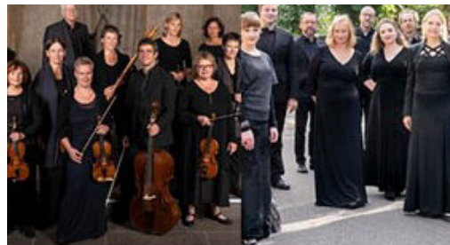
Das Kleine Konzert Rheinische Kantorei

1743 formierte sich in Leipzig „Das Große Konzert“, aus dem später das Gewandhausorchester hervorging – und wurde Vorbild für das Barockorchester Das Kleine Konzert . Präzises Zusammenspiel und meisterhafte Interpretationen zeichnen das Ensemble ebenso aus wie die plastische Darstellung von Affekten bis hin zu opernhafter Dramatik.